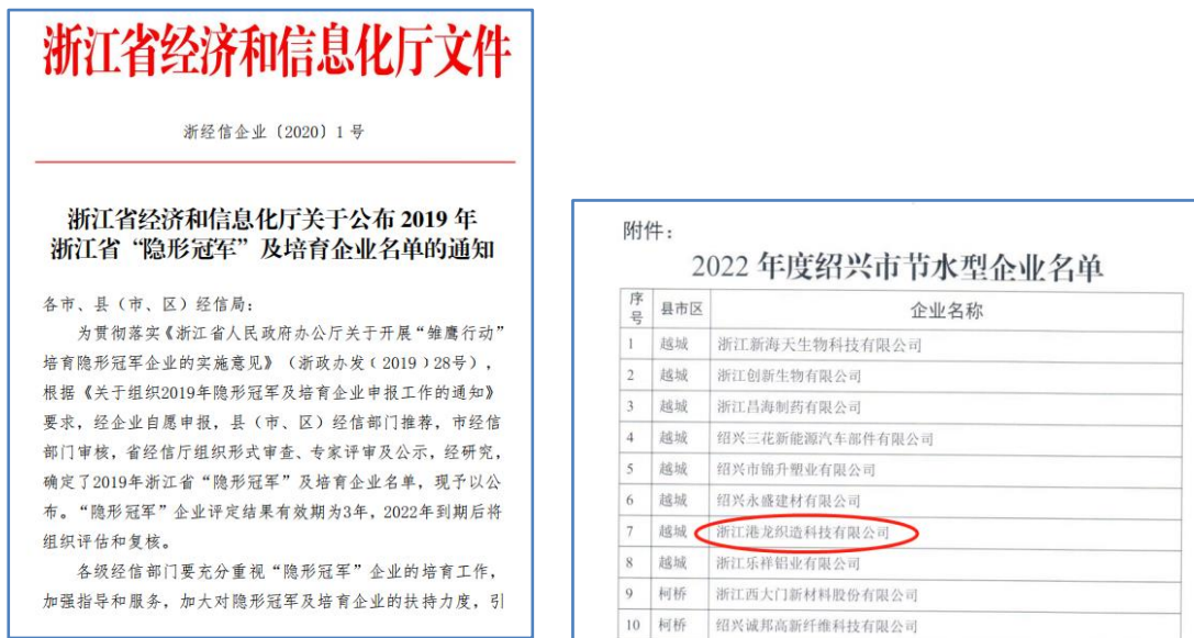
图 3.3-1 社会认可的证书（示例）

规培养对客户讲诚信，重合同，守信用；对社会讲诚信，守公德，行公益的行为准则。公司每年销售交易额翻倍增长，公司从不违约，也从不因为价格、质量、交货期、收付款等问题与客商发生过纠纷，深受国内外客户的信赖。为此，公司先后获得社会认可的“2019年浙江省隐形冠军培育企业”、“绍兴市企业研究开发中心”、2022年认定为浙江省“专精特新”中小企业、浙江制造精品、市级节水型企业、港龙市级数字化车间等荣誉，如图 3.3-1 所示：