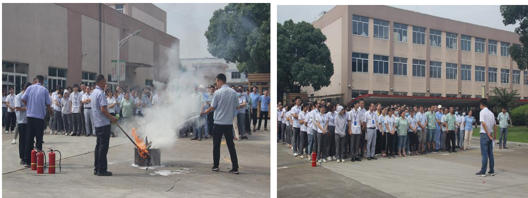
图 6.3-01 2022 年火灾应急演练记录

公司每年举行消防演练和各种灾害应急演练。公司制订了《危险化学品火灾爆炸事故专项应急预案》、《危险化学品中毒、窒息事故专项应急预案》、《特种设备事故专项应急预案》、《触电事故现场处置方案》和《合成工艺装置事故现场处置方案》等数十个现场处置方案和专项应急预案等，对火灾、中毒、机械、触电等均有相应的应急措施，并成立了应急指挥中心和应急救援专业组。每年 5 月份，公司联合消防中队成功举办消防灭火演习。生产制造部门、相关职能部门以及保安队共计 100 余人参加了消防灭火演练。